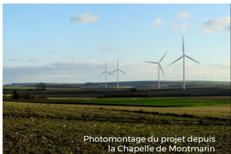
Photomontage du projet depuis la Chapelle de Montmarin

Toutes les informations et les actualités du projet sur www.parc-eolien-givry.fr